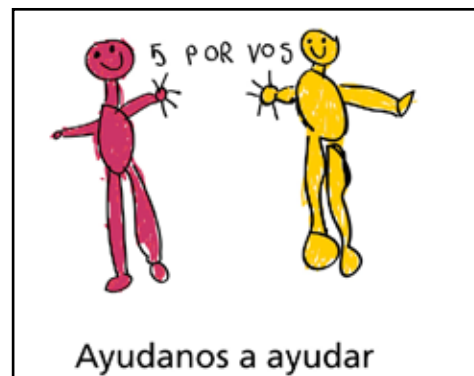
Una Ayuda a comedores infantiles de Buenos Aires, mediante la compra de alimentos.