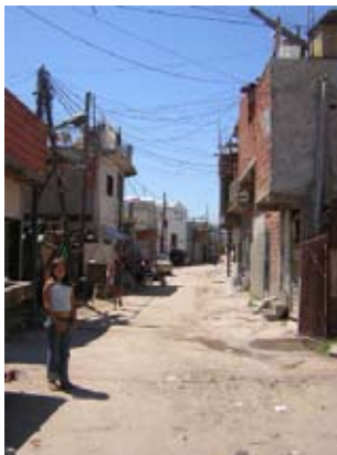
Villa Soldati, barrio Los Piletones, Capital Federal, Buenos Aires.